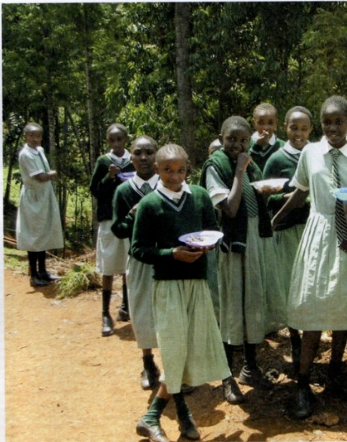
Při prvním obracení stránek s fotografiemi na mě vykoukl jeden sloupeček s nadpisem Hledá se dobrovolník do Keni. Přešel jsem to.

Když jsem přiletěl z Keni, všechno, ale úplně všechno se pro mě změnilo. Celý rok se jakoby otočil naruby. Soutěž NP a Humanistického centra Narovinu vlastně začala někdy v tomto čase minulého roku a já jsem tak strávil celých dvanáct měsíců při plánování cesty, shánění sponzorů, procházením přípravných kurzů, ale také jsem prošel obdobím nejistoty a velkého zklamání. To vše mám úspěšně za sebou a třešničkou na dortu byla vlastní měsíční cesta do Keni. Do úplně odlišné země s odlišnými zvyky, klimatem a mentalitou místních lidí.